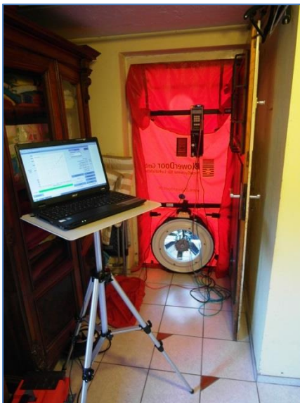
Blowerdoor-Einbaurahmen mit Gebläse und Messeinheit